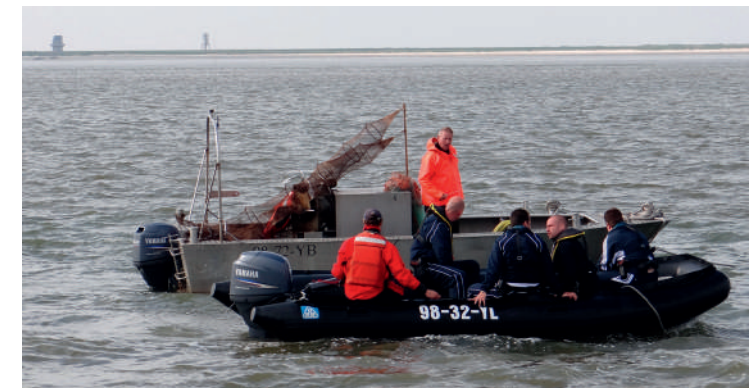
De Waddenunit assisteert bij oefening door politie

In het kader van de samenwerking met de politie werd door medewerkers van de Waddenunit meegedaan aan een oefening van de Politie Academie te Drachten. Andere deelnemers waren de Douane, de KMAR en de KNRM. In opleiding zijnde studenten werd een door de Waddenunit bedachte casus op het water voorgeschoteld. Een visser zonder vergunning (gespeeld door een medewerker Waddenunit) werd bij controle agressief tegen de BOA's (medewerkers Waddenunit) en de ter plaatse ter assistentie geroepen politiemensen mochten de zaak verder afhandelen. Dit leidde tot een aantal leerzame momenten voor alle partijen. Op het water gaan dingen toch vaak even wat anders dan op het land.... In 2014 doen we weer met een dergelijke casus mee op verzoek van de Politie Academie.