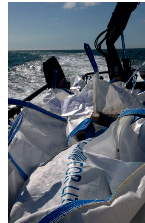
Schoonmaakactie Razende Bol

Op de strekdam voor de haven van Den Oever neemt jaarlijks een lepelaar kolonie haar intrek. Zo ook in 2013. Zo'n honderd exemplaren hebben eind april, begin mei de dam bezet. Elk jaar een wonderlijke vertoning. Elders in de Waddenzee broeden nog meer lepelaars.