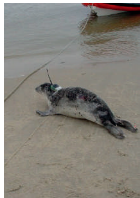
Een zeehond met zender gaat weer te water

In november werden de eerste jonge grijze zeehonden op het wad waargenomen. Ook deze bestanden worden structureel door de Waddenunit gemonitord.