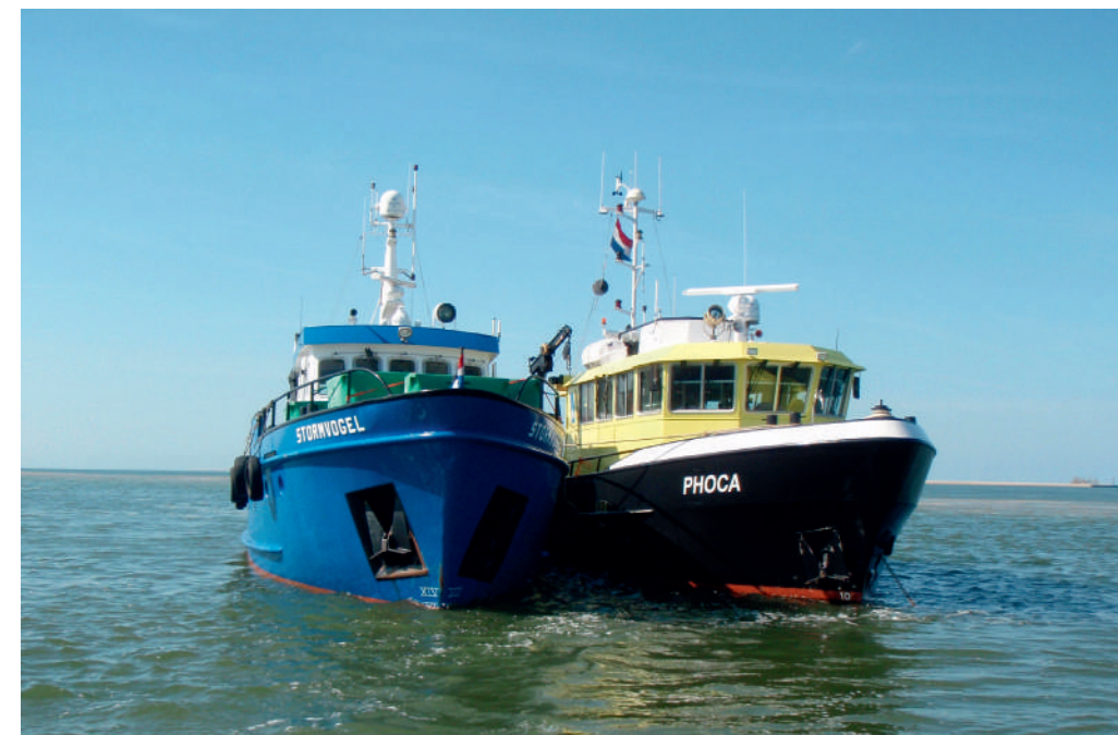
“Oud en nieuw” naast elkaar

bevestigden de besluitvorming. De werfbeurt ging hierna dus wel door. Dat resulteerde erin dat de Phoca als eerste schip van de Waddenunit met nieuwe kleuren het jaar 2014 in ging. De andere schepen zullen op termijn volgen. Dat wordt gekoppeld aan werfbeurten.