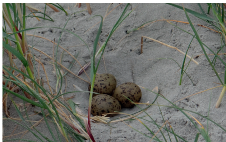
Nest van een visdief op het Rif

Het gehele jaar door worden de zeehonden door de Waddenunit gemonitord. Vaste ligplaatsen worden periodiek geteld. Begin juni werden de eerste jonge gewone zeehonden waargenomen. We hebben de indruk dat er wat minder dieren zijn dan daarvoor. Ook stellen we vast dat bepaalde ligplaatsen niet of minder worden gebruikt. Op andere plaatsen zien we dan een toename van dieren. Oorzaak hiervan is ons niet bekend. Kan zeker te