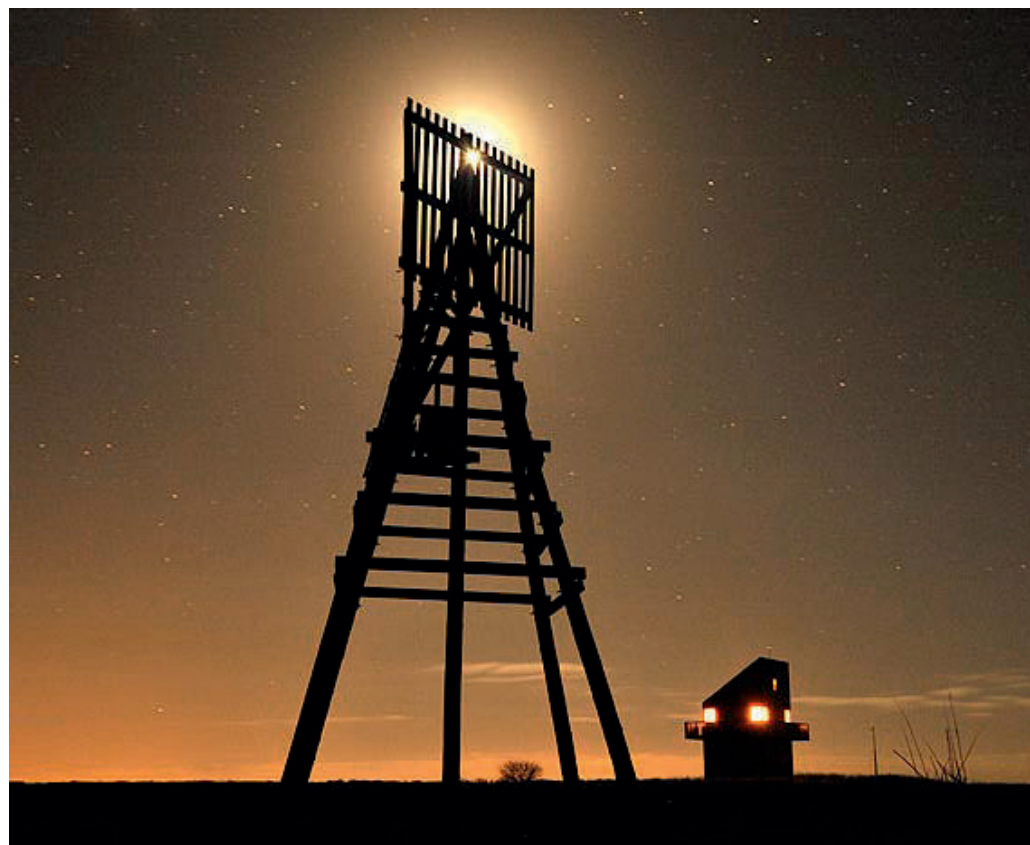
De Kaap en het vogelwachter huisje op het Vogeleiland Griend tijdens een heldere nacht, met een mooie sterrenhemel.