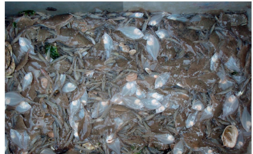
Garnalenvangst met bijvangst

Imares voert een onderzoek uit naar de bijvangst van garnalenvissers op de Waddenzee. De garnalenvissers die meedoen aan dit onderzoek, leveren zelf informatie aan Imares. Ten behoeve van de objectiviteit nam de Waddenunit in 2013 zesendertig monsters van bijvangsten van garnalenvissers. Dit aantal was volgens afspraak. De werkwijze is als volgt. Een participerende visser wordt benaderd tijdens het vissen. De Waddenunit komt aan boord en is vanaf het moment dat de netten worden gehaald aanwezig. Bij het sorteren van de vangst wordt alle bijvangst opgevangen en voor onderzoek verpakt en opgestuurd naar Imares. Dit onderzoek loopt nog door tot medio 2014.