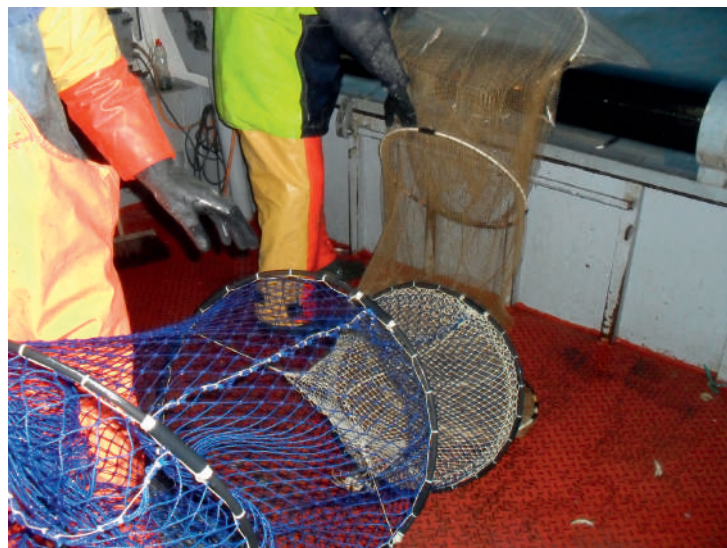
Aangepaste schietfuik voor wolhandkrabbervisserij