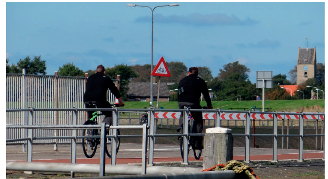
Soms is een fiets handig om ergens toezicht te houden

Door de Waddenunit werden in 2013 in totaal 26 processen verbaal gegeven. Daarnaast werden 11 (officiële) waarschuwingen uitgedeeld aan overtredders. Daarnaast werden vele bezoekers van het wad mondeling gewaarschuwd of attent gemaakt op de gevolgen van hun gedrag voor de omgeving.