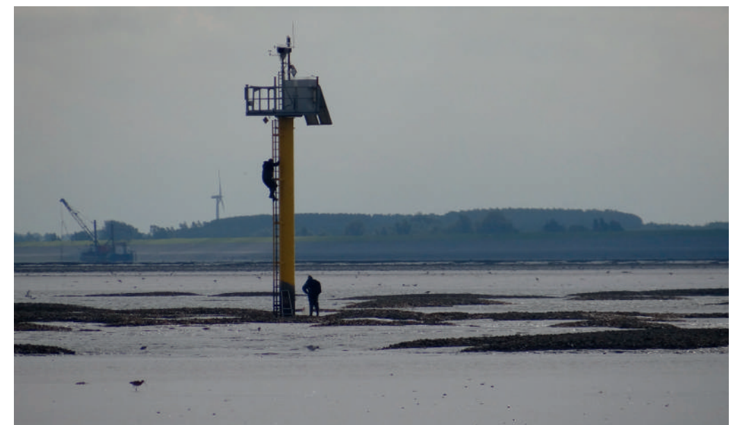
Onderhoud aan de camerapaal op het Brakzand tbv. project Waddensleutels

De Waddenunit verzorgt ook op diverse plaatsen camerapalen op de Waddenzee. Deze staan er voor diverse doeleinden. Apparatuur wordt verzorgd, vervangen en wat dies meer zij.