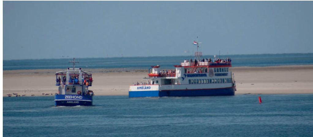
Robbenboten naderen zeehonden zeer dichtbij

maken hebben met verstoring door recreanten en/of robbentochten. Er is een trend waarneembaar dat mensen steeds dichterbij zeehonden willen komen om ze zo goed mogelijk te kunnen zien.