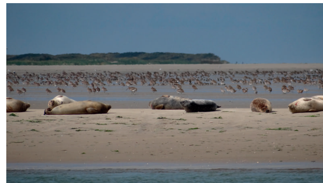
Zeehonden in de Blauwe Balg