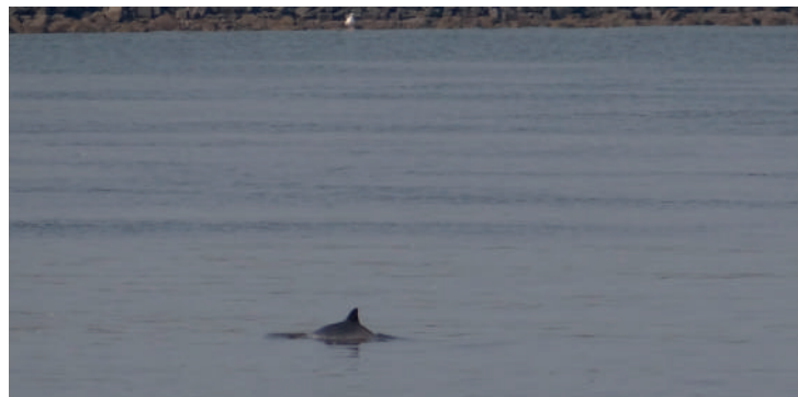
Foeragerende bruinvis bij de haven van Lauwersoog

Gebieden in de Waddenzee worden ook structureel in kaart gebracht met GPS. Er verandert nog weleens wat op het wad door de weersomstandigheden en de Waddenunit brengt dat dus zo snel mogelijk in kaart.