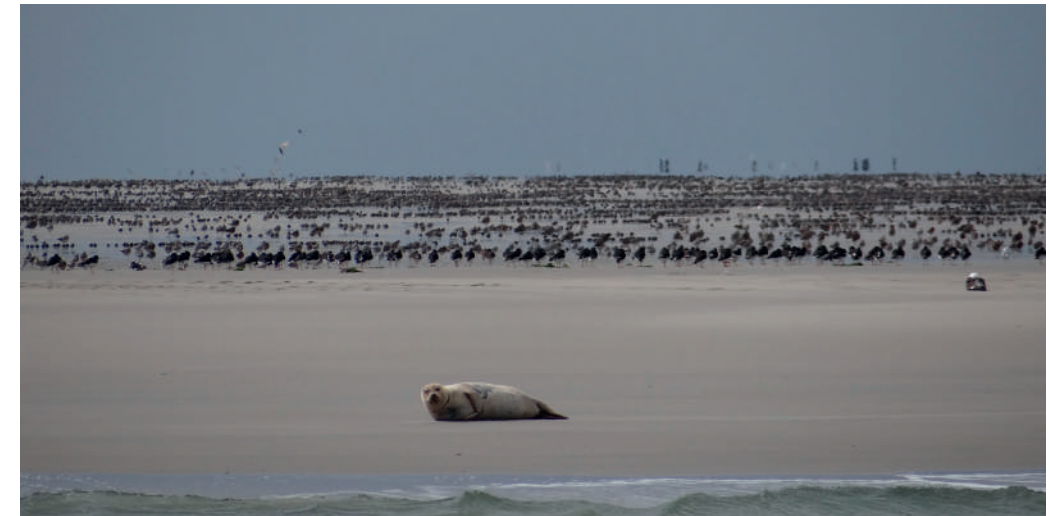
Hoogwatervluchtplaats met duizenden vogels in de Blauwe Balg

De Waddenunit heeft in 2013 op grote schaal tellingen verricht op de Waddenzee. Er worden structureel tellingen gedaan van vogels en zeehonden.