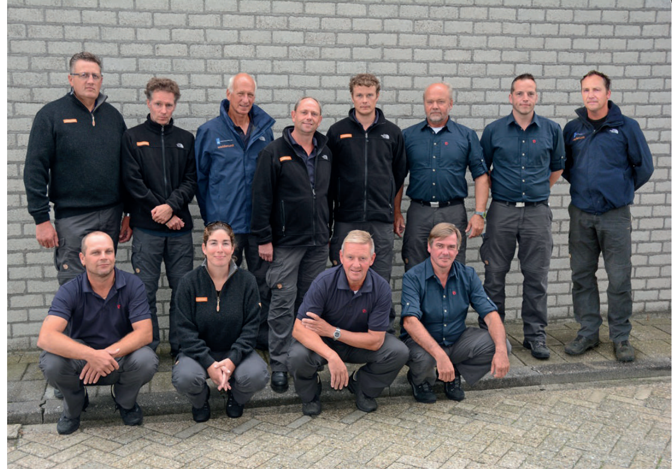
De medewerkers van de Waddenunit per 1 januari 2014.

Door een inspecteur van de NVWA (BOA begeleider) werd een BOA instructiedag verzorgd. Op basis van eigen casuïstiek werden praktisch optreden en aansluitend de wet- en regelgeving behandeld.